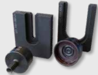
Montageplatte und Presswerkzeug für die Größen 6 und 42 mm

Der jeweilige Druck wird vor der Montage manuell eingestellt. Pro Durchmesser ist je eine Montageplatte sowie ein Presswerkzeug erhältlich. Beide sind beschriftet, um Verwechslungen vorzubeugen. Für die Ordnung am Arbeitsplatz sind Werkzeughalter lieferbar.